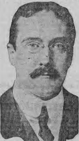
JAMES W. GERARD

James W. Gerard, American ambassador to Germany, is the Democratic candidate for United States senator in New York. His campaign is being conducted at long range, for he is still in Germany. Ambassador Gerard was appointed by President Wilson and is reported to have aided Americans in Germany greatly when the war broke out.