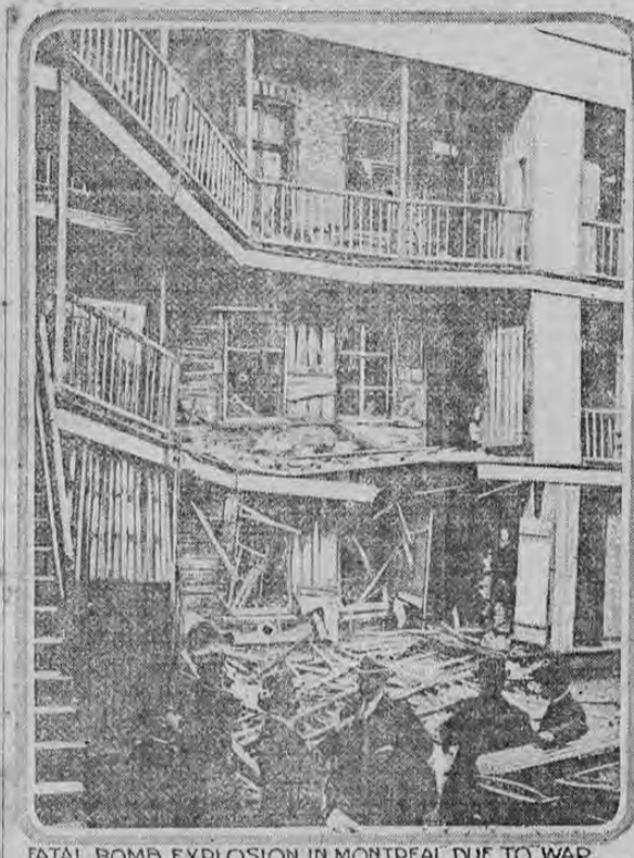
FATAL BOMB EXPLOSION IN MONTREAL DUE TO WAR.

El sentimiento nacional exaltado con motivo de la guerra dió margen a que se destruyera una casa de la vecindad de Montreal, Canadá. En el barrio ruso-austriaco-germano estaba situado este edificio en que se colocaron varias bombas. Hubo ocho muertos y treinta heridos. Se dice que la explosión ocurrió poco después de que varios labradores austro-polacos fueron obligados a desocupar el edificio, en donde tuviern una acalorada discusión con unos cuantos rusos.